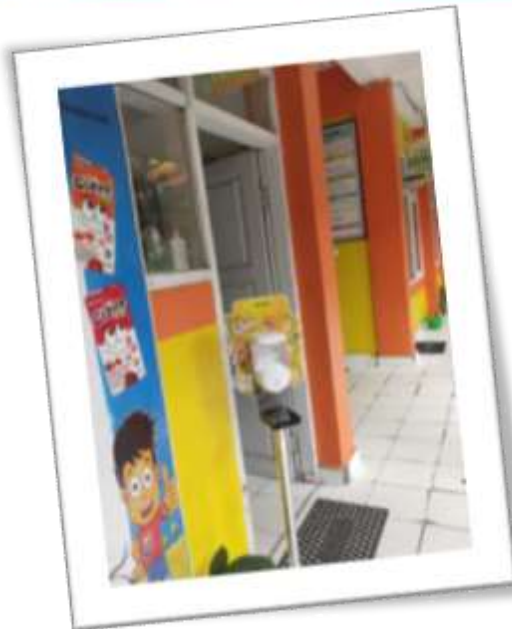
HAND SANITIZER OTOMATIS