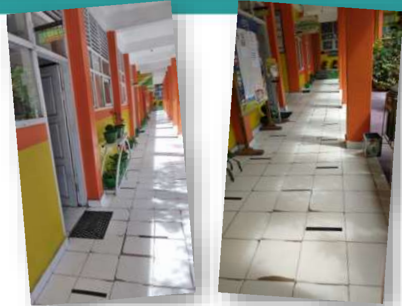
TANDA BERDIRI/ANTRI MASUK KELAS

HINDARI BERSENTUHAN, JARAK LEBIH DARI TANGAN TERLENTANG TIDAK BERSENTUHAN