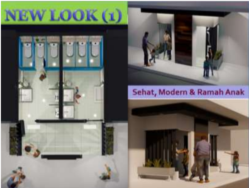
RENCANA TOILET BARU (DEKAT RUANG GURU)