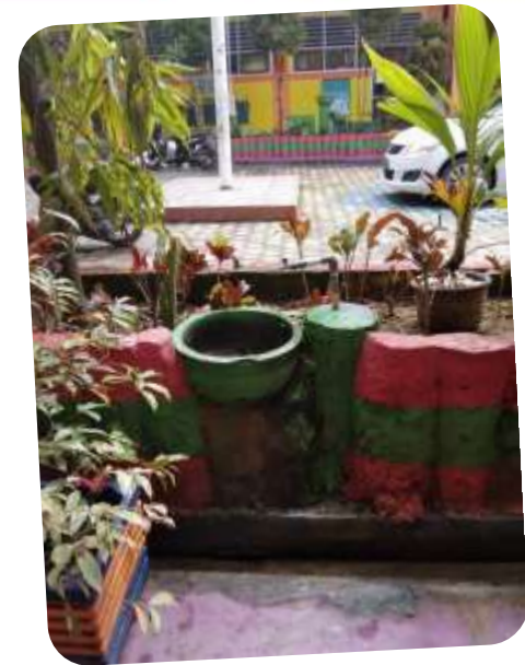
AIR MENGALIR + SABUN